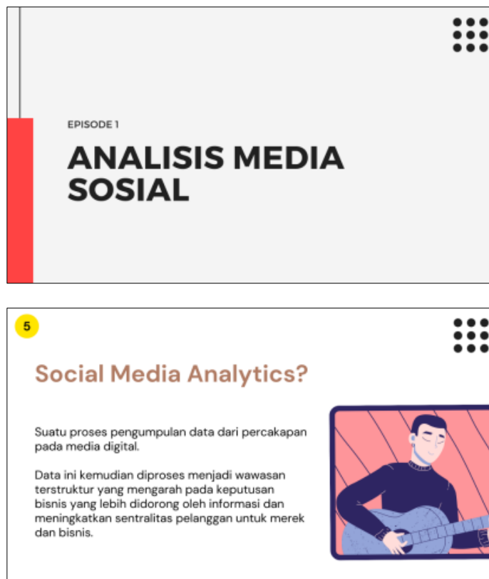
Gambar 2. Slide 1 dan 2 Materi Analisis Media Sosial

Berikut merupakan slide presentasi untuk materi Analisis Media Sosial yang diberikan oleh Bapak Putu Wirayudi Aditama, S.Kom., M.Kom. selaku narasumber: