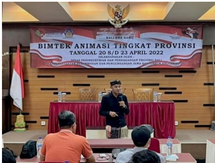
Gambar 4. Pemberian Materi Bimbingan Teknis Analisis Media Sosial

Menjelaskan tentang hasil atau luaran pengabdian bisa berupa peningkatan pengetahuan, keterampilan atau berupa produk. Hasil juga mengemukakan tingkat ketercapaian target kegiatan. Jika berupa benda perlu ada penjelasan spesifikasi produk, keunggulan dan kelemahannya.