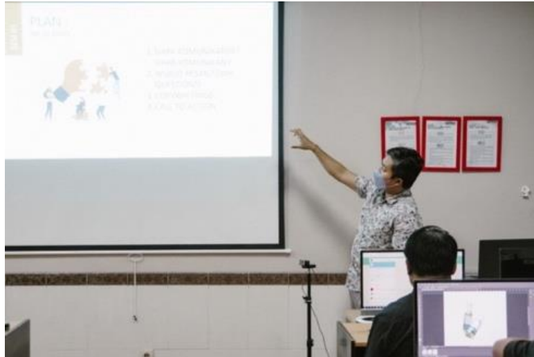
Gambar 3. Pemberian Materi Bimbingan Teknis Animasi untuk Pembelajaran

Dalam PKM ini dihasilkan foto-foto yang akan menjadi dokumentasi kegiatan ini. Berikut merupakan beberapa foto-foto dokumentasi bimbingan teknis Animasi untuk Pembelajaran dan Analisis Media Sosial kepada IKM binaan Disperindag Provinsi Bali.