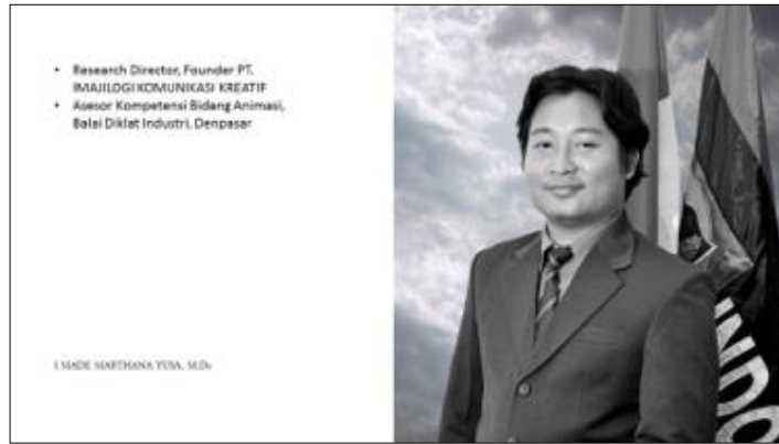
Gambar 1. Slide 1 dan 2 Materi Animasi untuk Pembelajaran

Hasil kegiatan ini adalah seluruh peserta IKM adalah membuat animasi sederhana untuk membantu produk atau jasa yang mereka tawarkan. Melalui bimbingan teknis yang telah dilakukan, diharapkan para IKM binaan Disperindag Provinsi Bali dapat menerapkan seluruh ilmu yang didapat dan memberikan feedback dalam meningkatkan kualitas produk atau jasa yang ditawarkan.