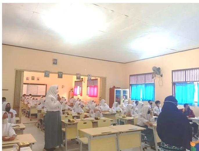
Gambar 4: Pelatihan Tips dan Trik Mahir Bahasa Inggris